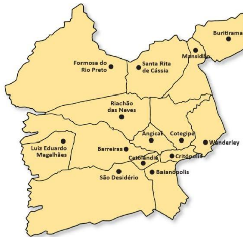
Mapa extraído do PMAS 2026/2029

após um histórico de desmembramentos que remonta à antiga Comarca do Rio de São Francisco e ao município de Angical.